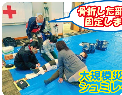
骨折した部分を固定します。