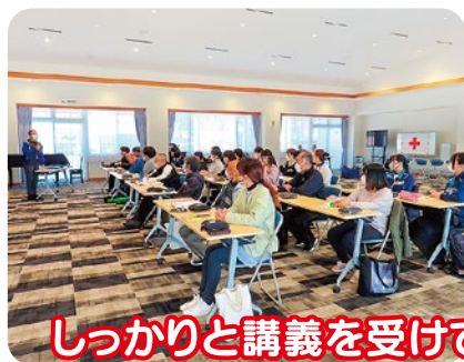
しっかりと講義を受けて、実技講習を行いました。

2月4日(日)、10日(土)、11日(日)の3日間を通して、南海トラフ地震や万が一の事故やケガから命を守り、市内各地で応急手当ができる人材を増やそうと、赤十字救急法基礎講習並びに赤十字救急法救急員養成講習会が5年ぶりに行われ、25名の参加がありました。いざというとき家族や身近な人を救うため、とっさの手当てや日常生活での事故防止など、健康安全に関する知識や技術の普及を目的に、住民同士がお互いに助け合える安心安全で温かな地域をつくるため、これからも取り組んでいきます。