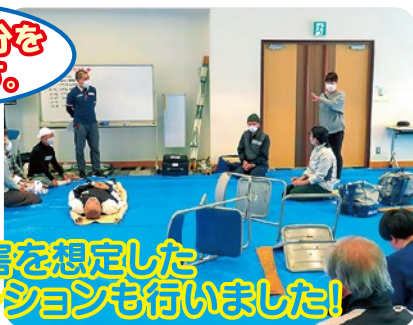
大規模災害を想定したシミュレーションも行いました!